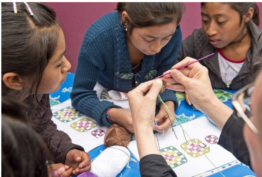
Unga kvinnor lär sig traditionellt hantverk i Guatemala.